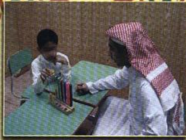
تدريس مهارة طرح الأصناف