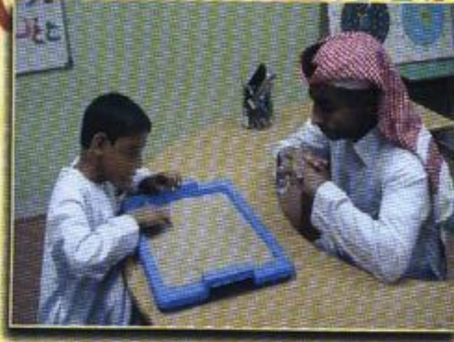
تدريس مادة الإملاء بالكتابة على الرمل