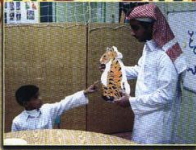
تدريس مهارة قراءة الصروف الهجائية