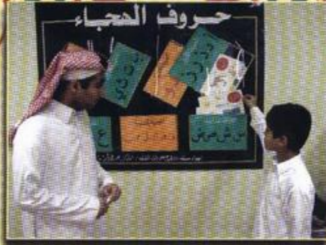
تدريس مهارة قراءة الحروف الهجائية

أوجه الاختلاف بين طلاب ذوي صعوبات التعلم والتأخر الدراسي وبطء التعلم