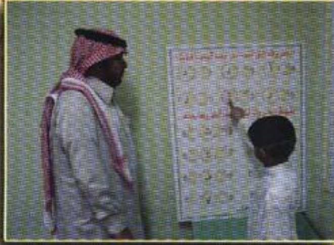
تدريس مهارة التصرف على أشكال الحروف وأوضاعها المختلفة