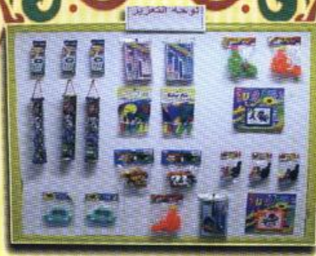
لوحة تعزيز الطلاب