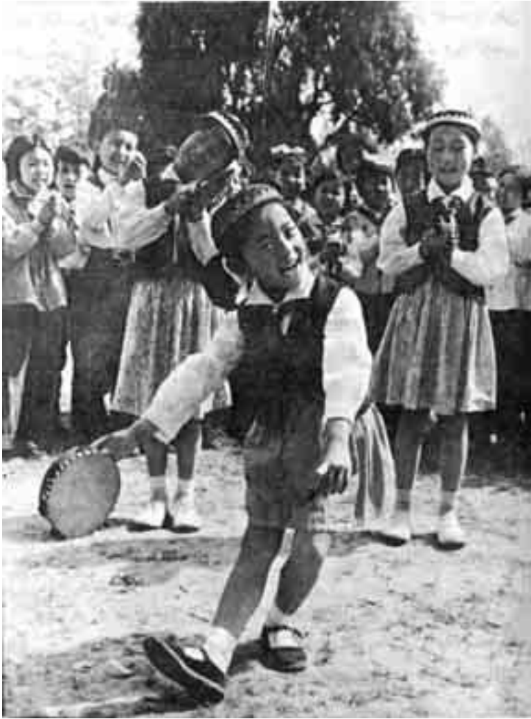
في عرس سينيكانغ، غناء الأطفال عنصر هام وممتع.