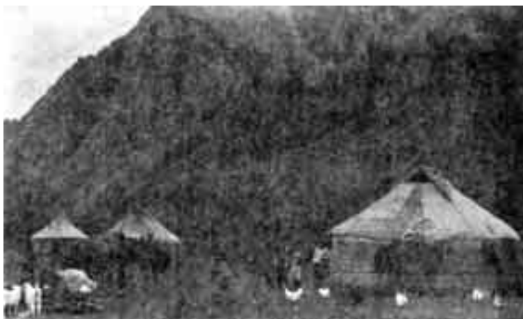
خيام القازاق المسلمين منتشرة في شمال وشرق الصين، ومضاربهم حيث العشب والمراعي.

ولأن مسلمي سينكيانغ الويغوريين شديداً التمسك بتقاليدهم الإسلامية، تماماً مثل مسلمي يوننان الهويين، فقد فشلت عمليات التهجير-برغم حجمها الكبير نسبياً-في أن تحقق هدف خلخلة هذه المجتمعات الإسلامية المتماسكة. حقا لقد أصبح مسلمو يوننان «أقلية» في المقاطعة، بسبب التهجير من ناحية ونتيجة للمذابح وعمليات الإبادة التي جرت من ناحية أخرى، ولكن تدهور أعدادهم لم يؤثر على تمسكهم بالتقاليد الإسلامية الراسخة في أعماقهم.