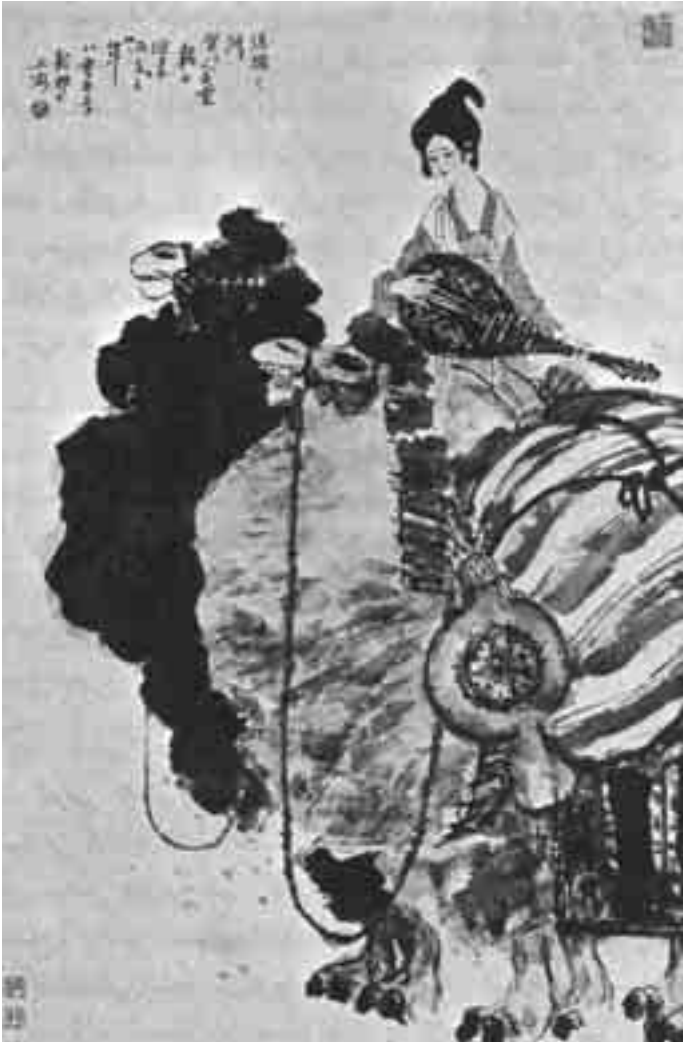
طريق الحرير بريشة دا دون بانغ

الأمر بعلاقاتهم بالعرب أو المسلمين، أو بغيرهم.