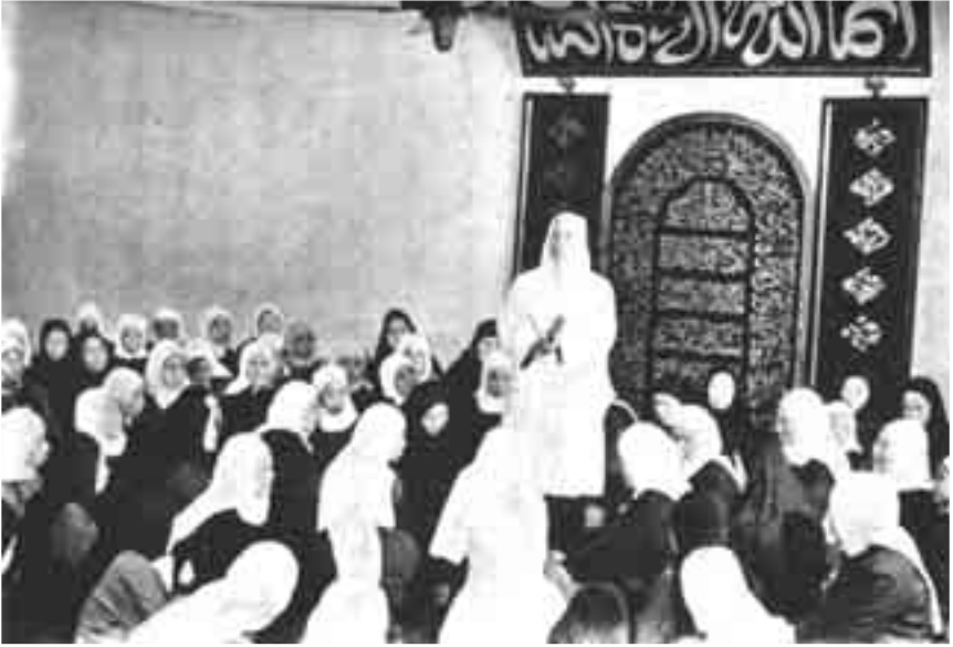
صورة تذكارية لفترة ما بعد التحرير مباشرة حيث كان للنشاط الإسلامى بقية، والصورة لسيدة تعظ أخريات فى أحد مساجد شنغهاي.