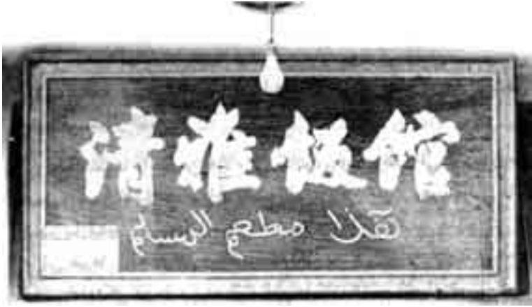
لافتة مطعم إسلامي في الصين.

العبارات. حتى بلغ عدد المطاعم التي من هذا النوع حوالي 65 مطعمًا في بكين، و55 في شنغهاي.