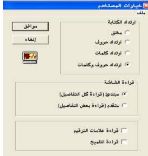
شكل رقم (٨)