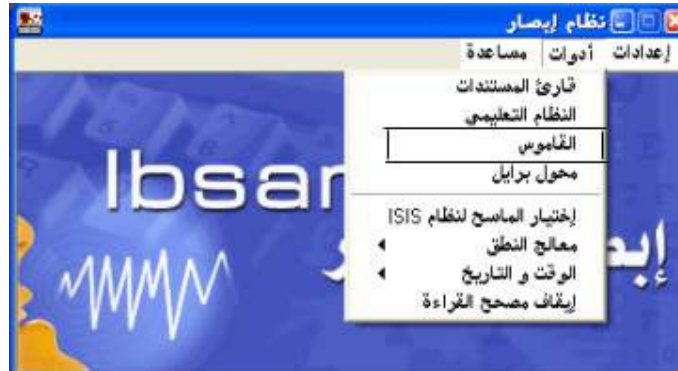
شكل رقم (٢٠)

إذا أراد المستخدم تشغيل القاموس فيقوم بالضغط علي أمر " القاموس " من قائمة أدوات؛ كما هو واضح في الشكل رقم (٢٠).