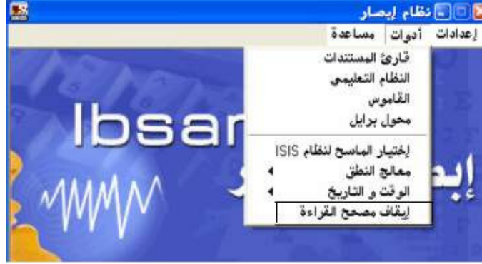
شكل رقم (٣١)

إذا أراد المستفيد تشغيل مصحح القراءة فسيقوم بالضغط علي أمر " تشغيل مصحح القراءة " من قائمة أدوات؛ كما هو واضح في الشكل رقم (٣١).