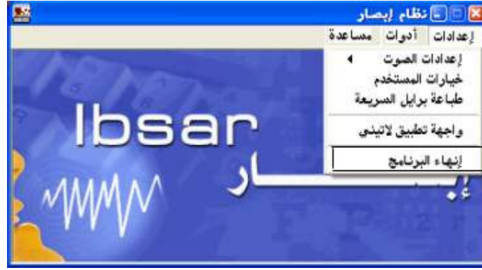
شكل رقم (١٣)

إذا أراد المستخدم الخروج من البرنامج فعليه أن يقوم بالضغط علي أمر " إنهاء البرنامج " من قائمة إعدادات؛ كما هو واضح في الشكل رقم (١٣).