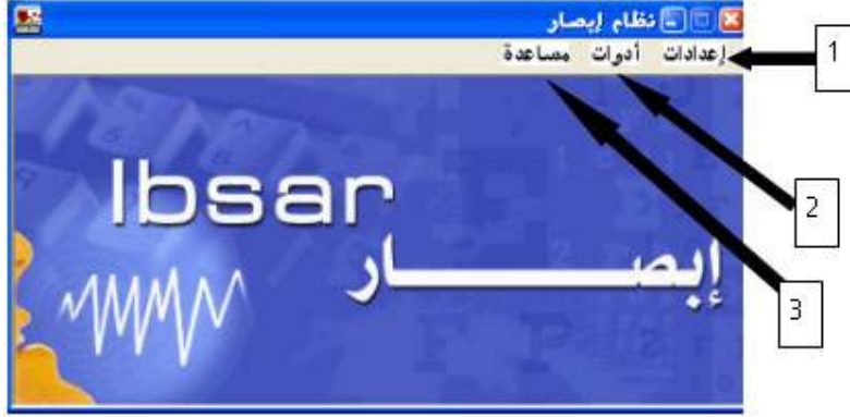
شكل رقم (1)

وكما هو واضح من الشكل رقم 1 أن الشاشة الرئيسية للنظام يوجد بها ثلاث قوائم منسدلة وهي: