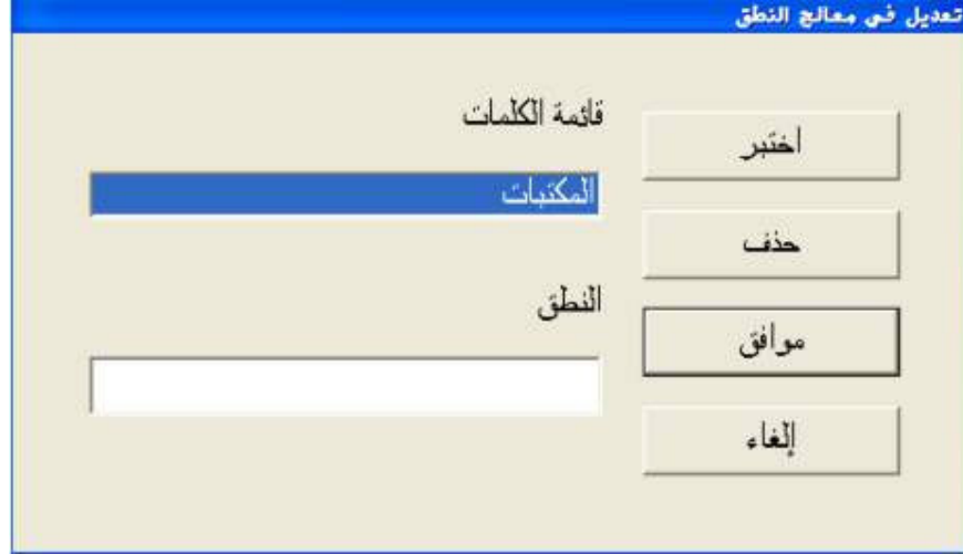
شكل رقم (٢٨)

هذه الشاشة تحتوي علي مجموعة حقول وهي حقل للكلمة التي ستنطق وهذا بالحقل يقوم بملئه المستخدم وهناك حقل خاص بالنطق؛ ثم هناك مجموعة من الاختيارات وهي أختبر؛ موافق؛ إلغاء. أما إذا قام المستخدم باختيار الأمر الثاني وهو "تعديل" فستظهر له الشاشة التالية الموجودة بشكل رقم (٢٨).