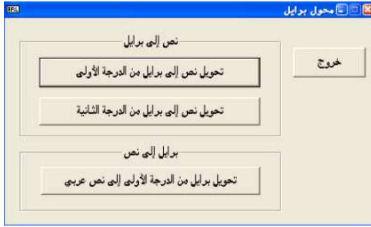
شكل رقم (٢٣)

٢- تحويل برايل إلي نص وهنا يتيح البرنامج خيار واحد فقط وهو تحويل برايل من الدرجة الأولى إلي نص عربي؛ كما هو واضح في الشكل رقم (٢٣).