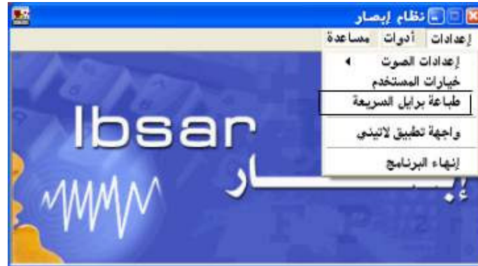
شكل رقم (٩)

إذا أراد المستخدم التحكم في إعدادات طباعة برايل السريعة فعليه أولاً بالضغط علي أمر " طباعة برايل السريعة " من قائمة إعدادات؛ كما هو واضح في الشكل رقم (٩).