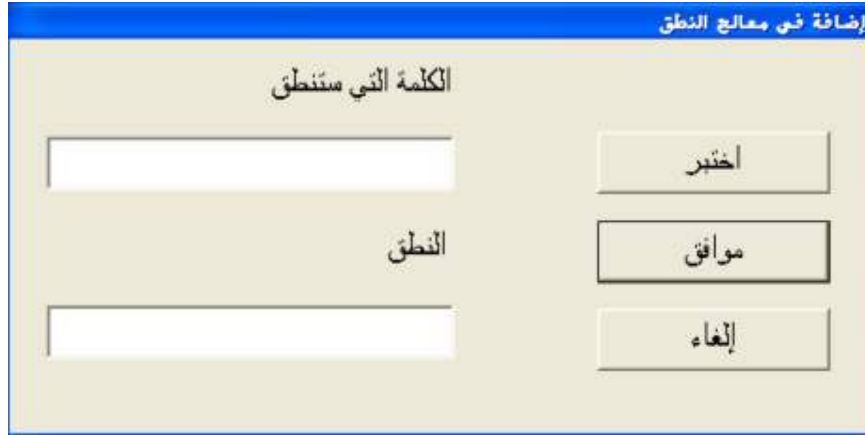
شكل رقم (٢٧)