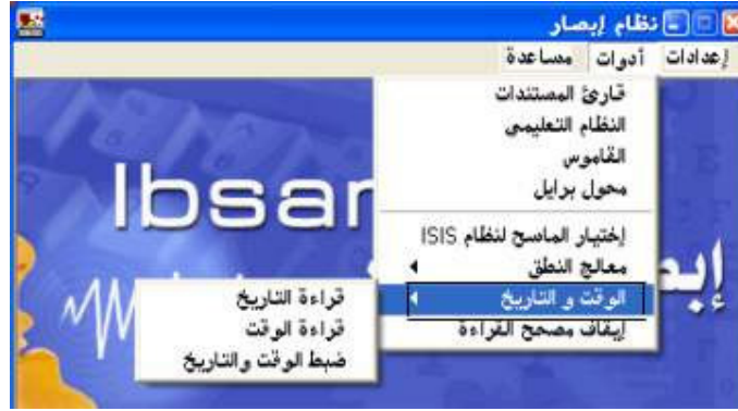
شكل رقم (٢٩)

إذا أراد المستخدم معرفة الوقت والتاريخ فعليه أن يقوم بالضغط علي أمر " الوقت والتاريخ " من قائمة أدوات؛ كما هو واضح في الشكل رقم (٢٩).