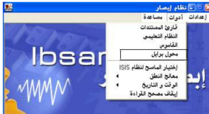
شكل رقم (٢٢)

إذا أراد المستخدم تشغيل محول برايل فيقوم بالضغط علي أمر "محول برايل" من قائمة أدوات؛ كما هو واضح في الشكل رقم (٢٢).