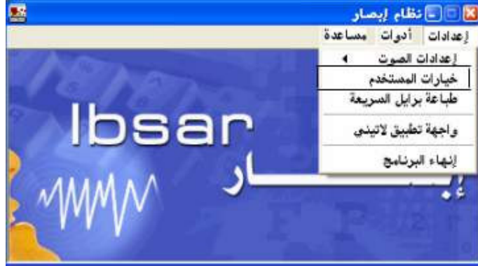
شكل رقم (٧)

إذا أراد المستخدم التحكم في الخيارات التي يقدمها البرنامج له فعليه أولاً بالضغط علي أمر " خيارات المستخدم " من قائمة إعدادات؛ كما هو واضح في الشكل رقم (٧).