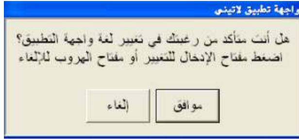
شكل رقم (١٢)

بعد الضغط علي أمر "واجهة تطبيق لاتيني" سيقوم البرنامج بإظهار شاشة ليتأكد البرنامج فعلاً من أن المستخدم يرغب في تغيير لغة واجهة الاستخدام ؛ وذلك عن طريق إعطاء المستخدم خياران إما بالموافقة أو بالإلغاء ؛ كما هو واضح في الشكل رقم (١٢) .