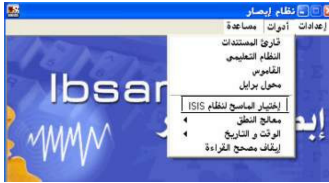
شكل رقم (٢٤)

إذا أراد المستخدم تشغيل اختيار الماسح فيقوم بالضغط علي أمر " اختيار الماسح لنظام ISIS " من قائمة أدوات؛ كما هو واضح في الشكل رقم (٢٤).