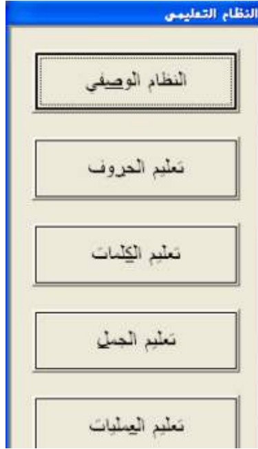
شكل رقم (١٩)

بعد تحديد المستوي المناسب للمستخدم ستظهر شاشة النظام التعليمي والتي توضح من خلالها كيفية تعليم الحروف والكلمات والجمل والعمليات؛ كما هو موضح في الشكل رقم (١٩).