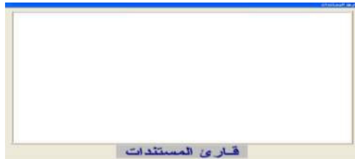
شكل رقم (١٦)

بعد الضغط علي أمر "قارئ المستندات" ستظهر شاشة قارئ المستندات والتي من خلالها يستطيع المستخدم قراءة أي نص سواء كان علي قرص ممغنط أو ملف علي جهاز الكمبيوتر ؛ كما هو واضح في الشكل رقم (١٦).