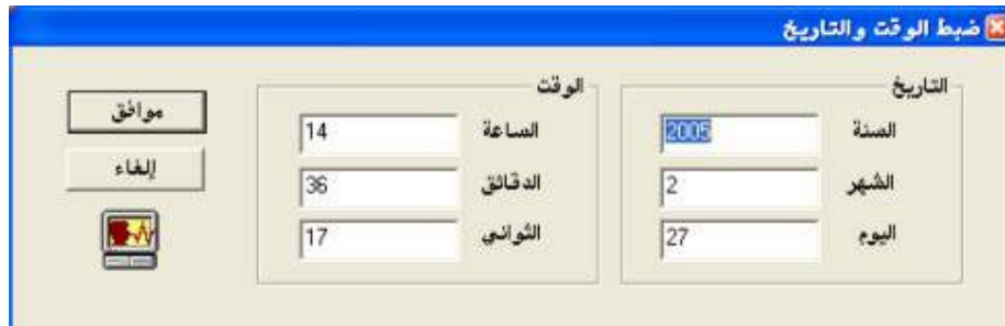
شكل رقم (٣٠)