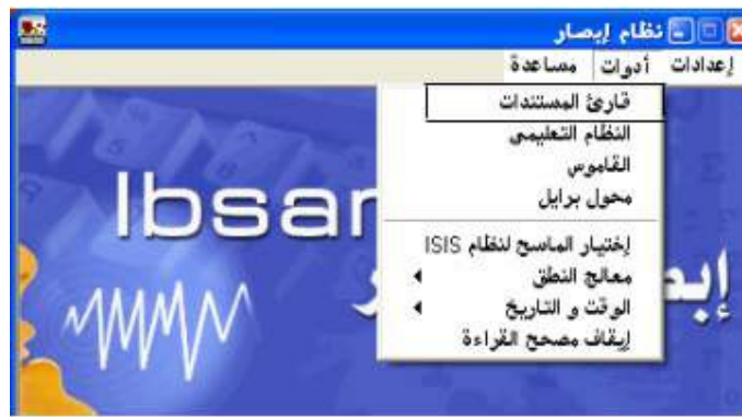
شكل رقم (١٥)

إذا أراد المستخدم تشغيل برنامج قارئ المستندات فيقوم بالضغط علي أمر " قارئ المستندات " من قائمة أدوات؛ كما هو واضح في الشكل رقم (١٥).