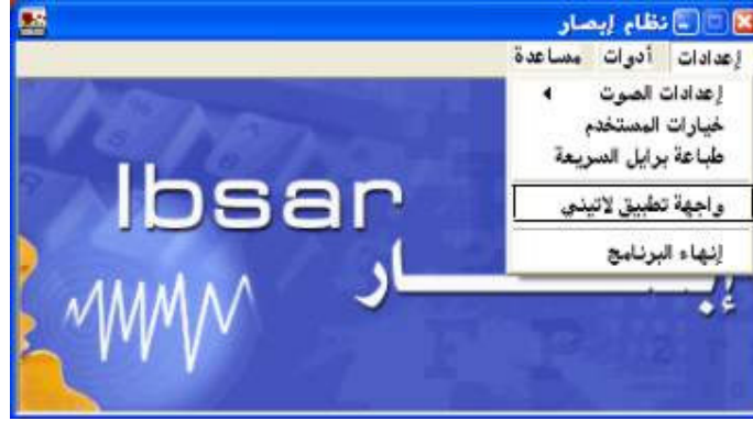
شكل رقم (١١)

هذا النظام يتيح إمكانية تغيير لغة البرنامج أو لغة واجهة الاستخدام من اللغة العربية إلى اللغة الإنجليزية والعكس ، ويتم ذلك بالضغط علي أمر "واجهة تطبيق لاتيني" من القائمة المنسدلة ؛ كما هو موضح بالشكل رقم (١١).