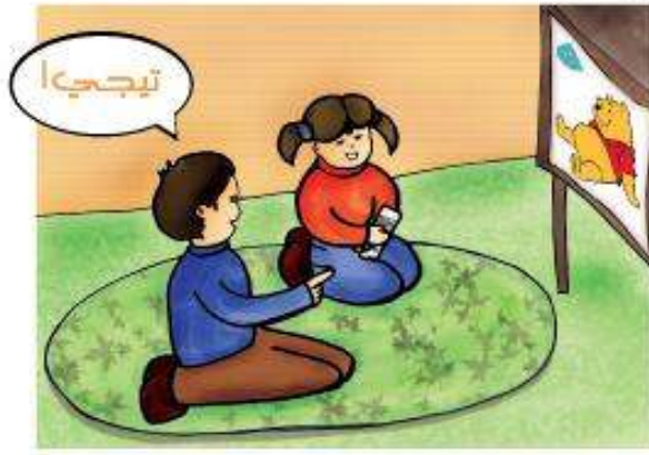
رأسي يعطيك من أختي فتاة العسيلة