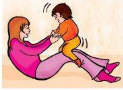
طرق يطلب جسدياً من أمه متابعة اللعبة