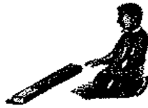
يلعب علويا من دون تصنع