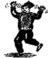
يتصرف بهلج عصبية