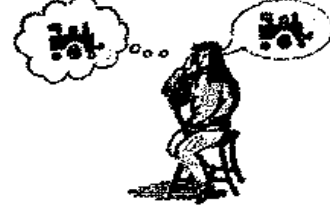
يكبر الحديث المتواصل حول موضوع واحد