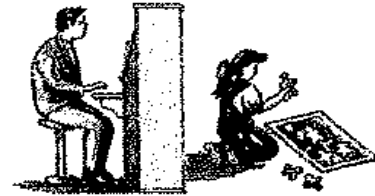
ولكن هناك منهم من يقوم ببعض الاعمال بشكل سوي إذا كانت لا تتنافس تقاهما اجتماعيا