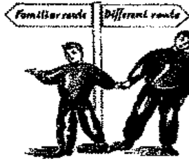
يفضل ممارسة الاعمال المتشابهة