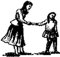
لا يواجه بالنظر