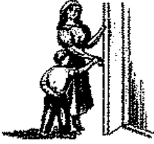
يشير إلى احتياجاته باستخدام يد أحد الكبار