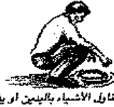
يتناول الأشياء باليمين أو يفتلها