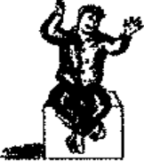
يضحك ويهتف بطريقة غير مناسبة