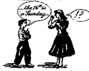
إعادي الجانب في التفاعل مع الآخرين